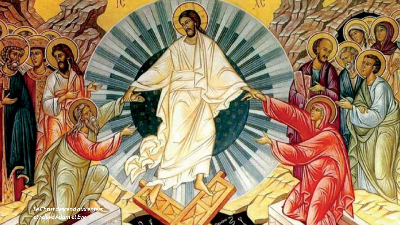
Le Christ descend aux enfers et relève Adam et Eve