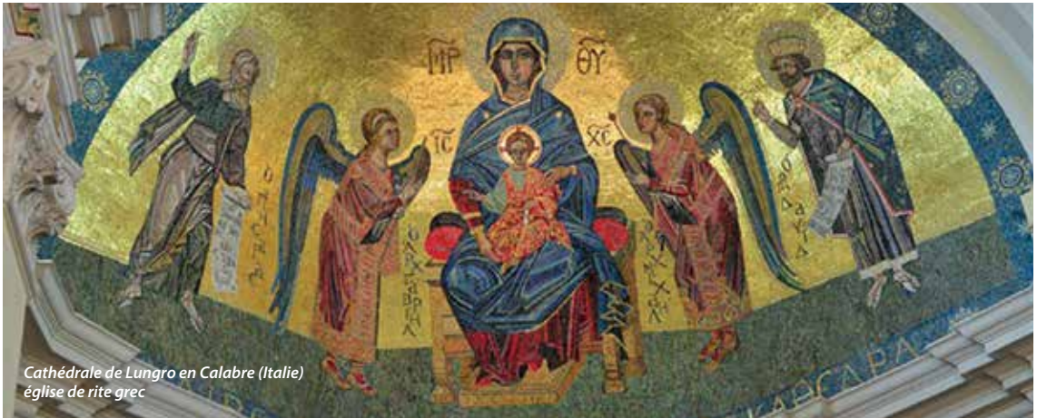
Cathédrale de Lungro en Calabre (Italie) église de rite grec

En effet, pour être parfait, ce retour requiert la conscience, c'est-à-dire l'intelligence. Plus encore, il ne peut se faire que dans un acte de louange : ce que Dieu donne par grâce, retourne vers Lui en action de grâces. Si la création jaillit du chant du Créateur 6 , les créatures doivent lui répondre par leur propre chant. De même que le don de Dieu appelle le Fiat de Marie qui seule le reçoit pleinement, de même tout le cosmos appelle un Magnificat qui seul le retourne pleinement. Une telle psalmodie rythme parfois à leur insu beaucoup de chercheurs émerveillés.