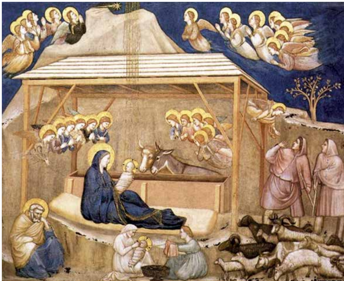
La Nativité - Giotto. Basilique inférieure à Assise

En ce mois de décembre 2016, l'équipe de l'Alouette vous souhaite, avec les anges, un joyeux Noël et, avec le pape François, une Année « imprégnée de la force rénovatrice de la miséricorde ».