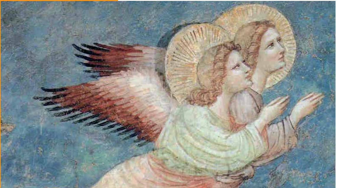
Giotto - Les anges de l'annonce aux bergers

De tout leur être, les anges sont serviteurs et messagers de Dieu