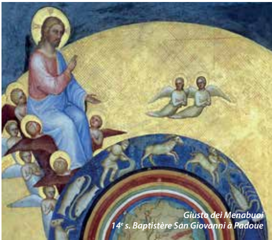
Giusto dei Menabuoi 14 e s. Baptistère San Giovanni à Padoue

Alors que nous avons tendance à nous représenter les anges dans un monde à part, il nous faut nous rappeler que l'univers est un. De nombreux Pères de l'Église étaient surpris qu'aucun des deux récits de la création ne fasse mention des anges (Gn 1-2). Saint Augustin est celui qui a poussé le plus loin l'effort d'intégration des anges dans le récit biblique de la création. Pour cela, il part d'un autre fait intrigant : selon Gn 1,3, la lumière fut créée le premier jour, au tout début, donc sans source et sans support. Or, la lumière a besoin d'une cause, les astres. Seule réponse, selon lui : «cette lumière primitivement créée n'est pas corporelle, mais spirituelle 2 ». Autrement dit, Dieu a d'abord créé les anges au jour un. Créés en premier, ils vont jouer