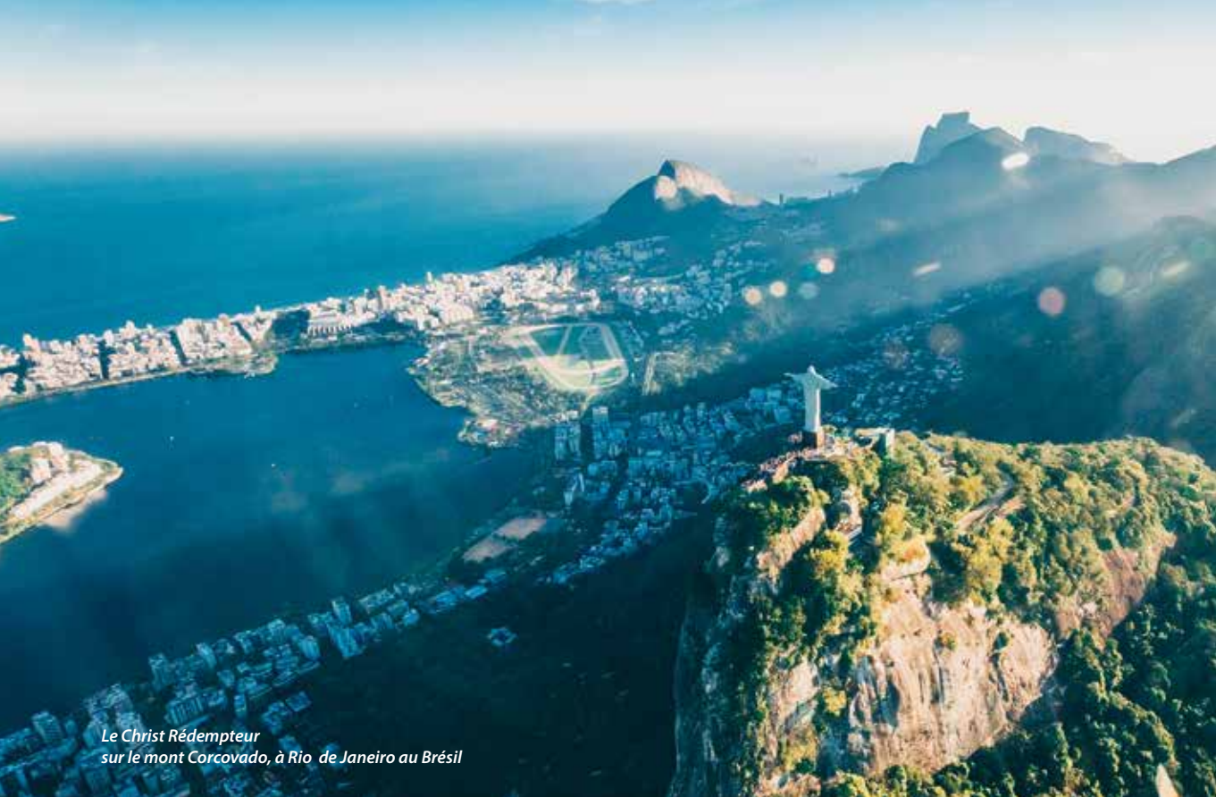
Le Christ Rédempteur sur le mont Corcovado, à Rio de Janeiro au Brésil