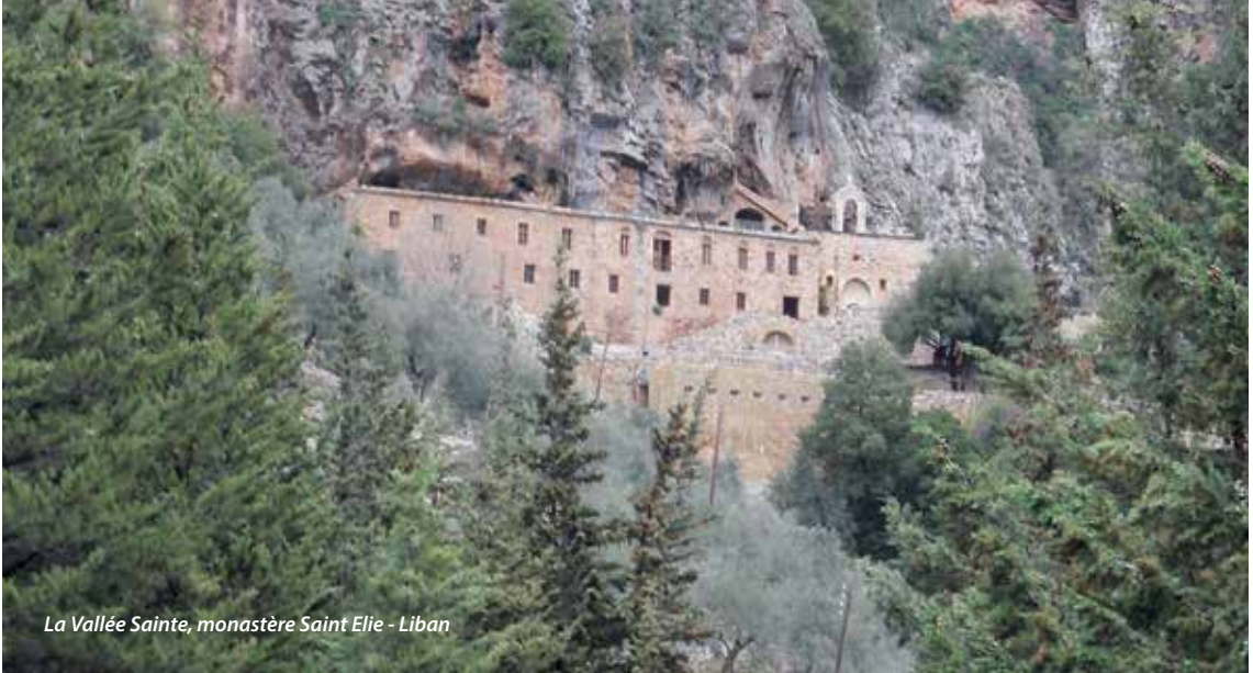
La Vallée Sainte, monastère Saint Elie - Liban

Étant née au cœur de cette réalité, elle m'a longtemps parue normale. Puis le Seigneur m'a invitée à faire un chemin pour accueillir vraiment et consciemment cette richesse et cette diversité afin de vivre plus unifiée. En 2005, quelques mois après mon entrée au Foyer de la Flatière, je suis venue vivre à Châteauneuf-de-Galauré la retraite des dix jours au Cénacle, de l'Ascension à la Pentecôte. Un soir est montée en moi cette question : « Seigneur, à quoi ça sert toutes ces origines si diverses qui me constituent ? Si cela est, si tu l'as voulu, c'est forcément pour quelque chose, non ? ». Un peu plus tard j'ai entendu en mon cœur cette parole : « Marie, c'est pour que tu sois un trait-d'union. » En 2013, j'ai lu pour la première fois des ouvrages de pasteurs protestants et ai participé à l'automne à mon premier rassemblement dans l'unité des chrétiens. Quelques mois plus tard, j'ai vécu une très vive prise