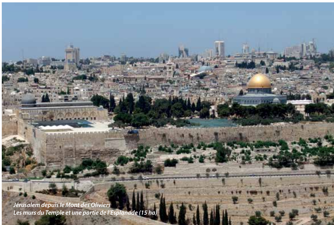
Jérusalem depuis le Mont des Oliviers Les murs du Temple et une partie de l'Esplanade (15 ha)

« Quelles pierres, quelles constructions ! » disent les apôtres éblouis. Et Jésus d'ajouter tranquillement : « Vous regardez ces pierres, ces grandes constructions ? Il n'en restera pas pierre sur pierre qui ne soit renversée ! » (Marc 13, 1 et 2).