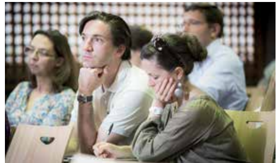
Au Foyer de Tressaint

de la famille de Dieu (Ep 2,19). C'est ici, dès le « cénacle » de la retraite, que nous « participons à une nouvelle Pentecôte » (4) , en étant constitués disciples-missionnaires, envoyés pour offrir nos existences par la foi agissant dans la charité (Ga 5,6). ■