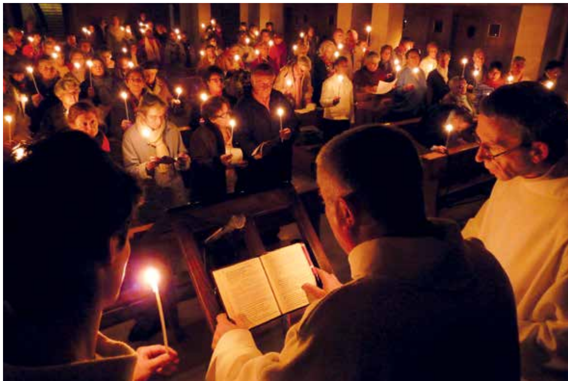
Veillée pascalle au Foyer de la Part-Dieu à Poissy

Cependant le renoncement ne suffit pas. La démarche ne serait pas complète sans le « nous croyons ». Pourquoi ? Tout d'abord, parce que nous avons besoin de confesser explicitement la foi, comme le dit Saint Paul : « c'est avec la bouche que l'on affirme sa foi pour parvenir au salut (Rm 10,9) ». Ensuite, parce que ce rituel n'est pas un protocole pour ratifier les résolutions de fin de retraite (!). C'est un moment de grâce, l'occasion d'une remise de soi plus sincère et plus profonde. Il est donc logique que cette célébration soit suivie d'une consécration à Jésus par Marie : c'est par Marie qu'Il est venu à nous, en elle nous trouvons un soutien sûr dans notre configuration au Christ. Ainsi, par la profes-