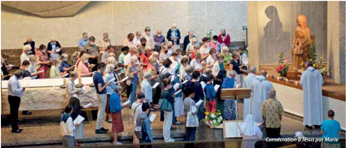
Consécration à Jésus par Marie

le Verbe de Dieu vient nous rejoindre. L'écoute de la Parole est à la fois un travail de la raison et une mise en contact, par la foi, avec Dieu qui parle et qui sauve. « Articulées sur cette prédication, la célébration des sacrements (Eucharistie, sacrement du pardon, Onction des malades) et les veillées permettent au retraitant (...) d'expérimenter personnellement le salut et en rendre grâce » (2) . Ainsi, l'enseignement vient expliciter ce qui se vit dans les autres moments de la retraite.