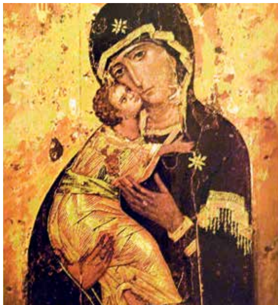
La Théotokos de Vladimir

l'état d'une société) et l'ère nucléaire, précédée de la personnalisation de la machine, ont confirmé cette explosion. C'est alors que certains penseurs en appellent à « un christianisme renouvelé qui pourrait ouvrir les voies de la beauté » 5 .