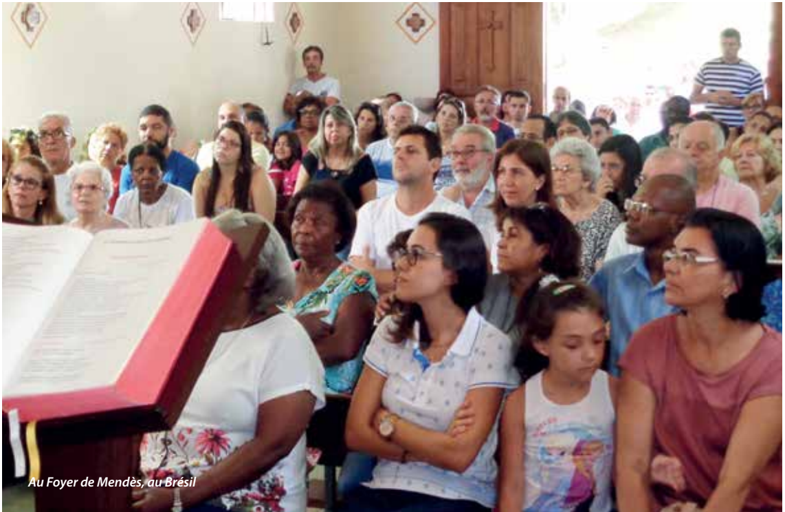
Au Foyer de Mendès, au Brésil

pour nous faire grandir et avancer sur le Chemin que nous trace notre Dieu et Seigneur... Il est indispensable de réaliser dans notre vie de tous les jours, dans « l'instant présent » ce que signifient ces rites sacrés, et donc de nous appliquer à vivre dans l'esprit même du Christ Jésus, à savoir les Béatitudes :