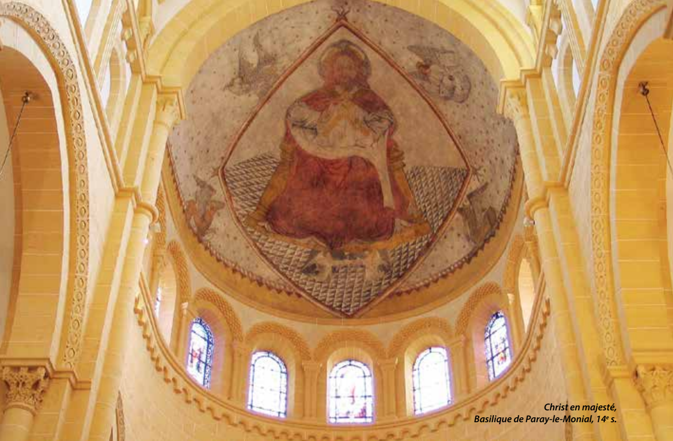
Christ en majesté, Basilique de Paray-le-Monial, 14 e s.