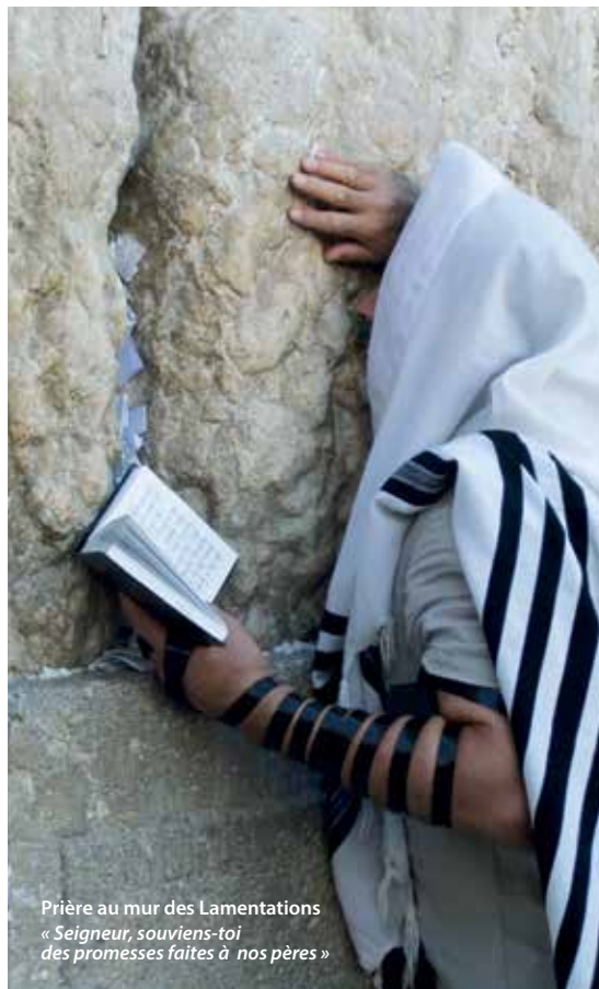
Prière au mur des Lamentations « Seigneur, souviens-toi des promesses faites à nos pères »

Dans son cantique d'action de grâce, le Magnificat, elle-même comprend que cet événement est une mémoire qui se transmettra : « Désormais, tous les âges me diront... »