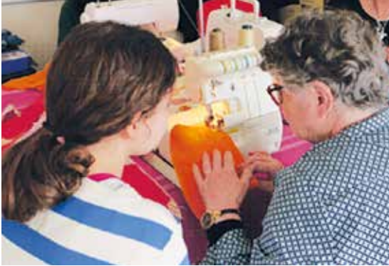
L'atelier couture, lieu d'échange intergénérationnel

En tant que salariée de cette association, j'ai la chance d'être au cœur du fonctionnement, et surtout des échanges. Une collègue m'a dit un jour, qu'à l'Accorderie, c'est un panel de l'humanité qui se rencontre, et je ne peux que confirmer. Dès que la confiance est là, la parole s'ouvre, et en chaque personne, une histoire si riche : équilibre complexe entre souffrances, difficultés, et résilience, adaptation, liens. Je ne peux que rendre grâce pour ces témoins de Vie qui, sans prétention et en silence, œuvrent pour adoucir et simplifier le quotidien de ceux qui les entourent.