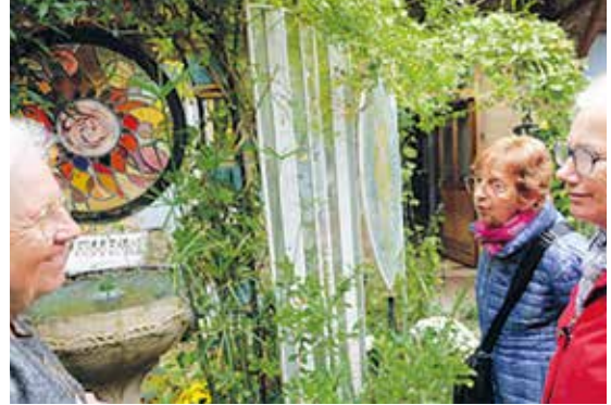
Découverte de l'art du vitrail

Cette personne qui a vécu treize ans en hôpital et institutions mais qui n'a rien perdu de ses grandes compétences manuelles et qui fait preuve d'une serviabilité sans faille. Celle qui a perdu son fils et a pris le relais pour élever ses petits-enfants ; aujourd'hui arrière-grand-mère, si heureuse de pouponner les petits-enfants de celui qui ne peut le faire. Celle qui a vécu deux guerres, qui les raconte avec émotion et humilité, et qui porte un regard si doux sur notre monde et ses modes. Celle qui vit dans un corps douloureux, mais qui donne son énergie à des associations locales pour aider à améliorer les conditions de vie d'inconnus.