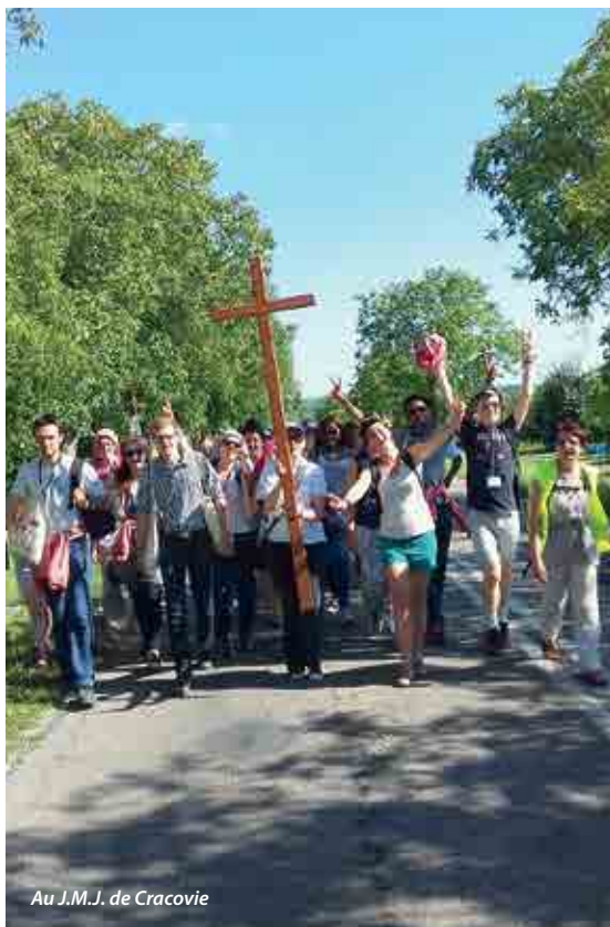
Au J.M.J. de Cracovie

vous rencontré ce regard ? Avez-vous entendu cette voix ? Avez-vous ressenti cette ardeur à vous mettre en route ? Je suis sûr que, même si le vacarme et la confusion semblent régner dans le monde, cet appel continue à résonner dans votre âme pour l'ouvrir à la joie complète. Ceci sera possible dans la mesure où, avec également l'accompagnement de guides experts, vous saurez entreprendre un itinéraire de discernement pour découvrir le projet de Dieu sur votre vie. Même quand votre parcours est marqué par la précarité et par la chute, Dieu riche en miséricorde, tend sa main pour vous relever.