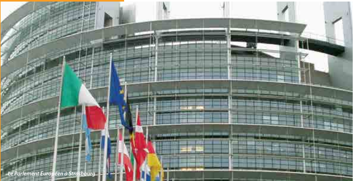
Le Parlement Européen à Strasbourg