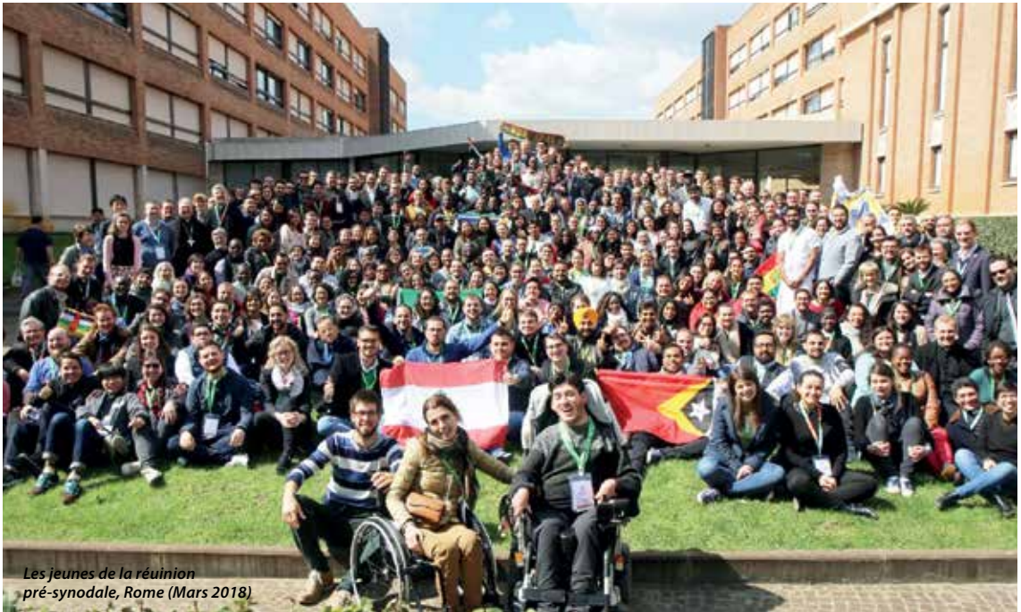
Les jeunes de la réunion pré-synodale, Rome (Mars 2018)

Des siècles plus tard, au Concile Vatican II, dans la Constitution Dogmatique sur l'Église, Lumen Gentium , il est dit combien le Peuple de Dieu tout entier est missionnaire. Ce n'est pas réservé aux prêtres, diacres ou religieux, religieuses, mais c'est bien le Peuple de Dieu tout entier qui est appelé à témoigner de la foi en Christ, mort et ressuscité, c'est l'Église tout entière qui est missionnaire. Le pape le rappelait au terme du Synode sur les Jeunes au Vatican : « Tu es missionnaire ! »